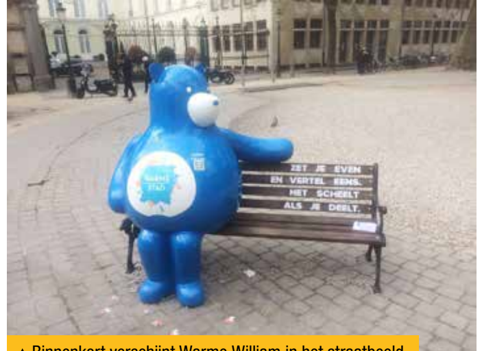
▲ Binnenkort verschijnt Warme William in het straatbeeld.