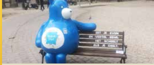
Begijnendijk-Betekom wordt warme gemeente (p. 2)