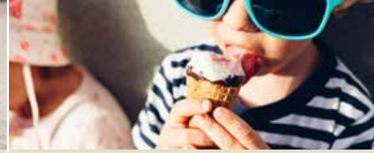
Gemeente brengt verkoeling op zomerkampen (p. 3)